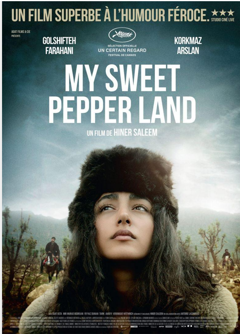
Bande annonce - 1'43"