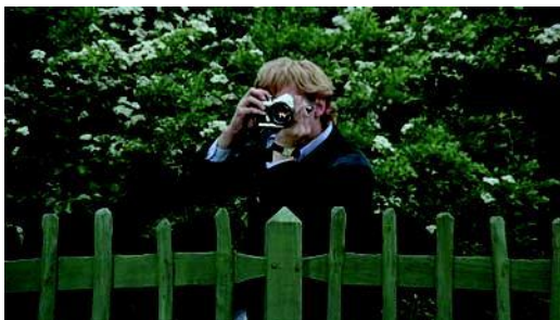
Blow Up de Michelangelo Antonioni (1966) – Carlo Ponti Productions.