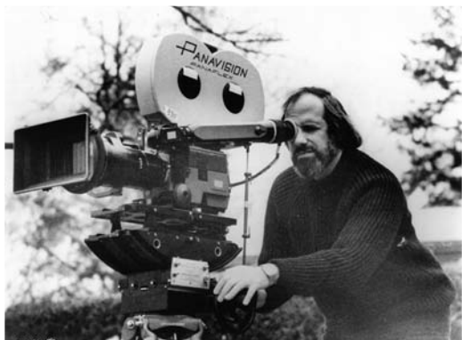
Brian de Palma au début des années 80