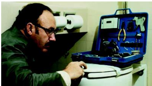
Conversation secrète de Francis Ford Coppola (1974) – Paramount Picture.