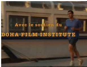
Course en solo

Le jogging (50'50) comme métaphore du parcours