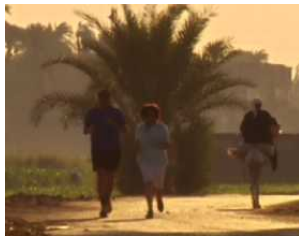
entrée de la mère