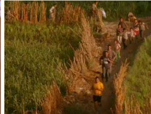
adhésion de tous