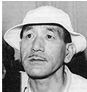
Yasujirô Ozu 1903-1963